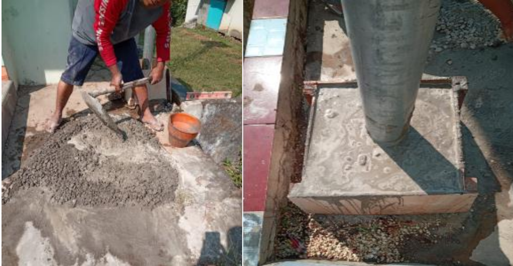
Gambar 7 Pengecoran pondasi PJU