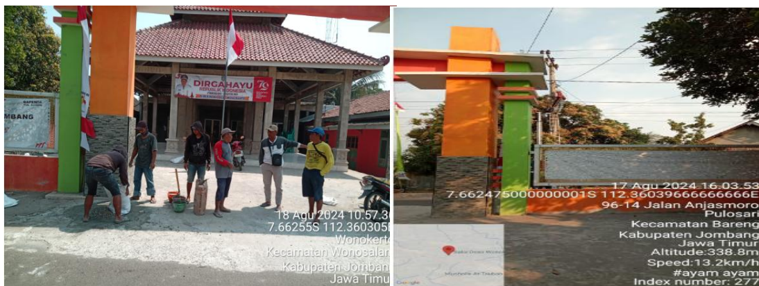
Gambar 4 Kegiatan persiapan pengecoran PJU di depan kantor Desa Wonokerto

Desa Wonokerjo merupakan jalur alternatif perlintasan Wonosalam-Mojokerto, Wonosalam ke bareng, Mojowarno dan Mojoagung.