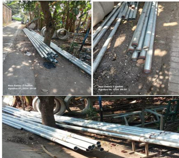
Gambar 2 Kegiatan Awal Pengangkutan Tiang PJU & Galian Pondasi Tiang PJU