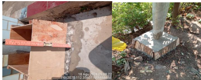
Gambar 3 Pengukuran Dimensi Galian

Jombang, Jawa Timur. Teknik pengumpulan data pada penelitian ini, yaitu melalui observasi, wawancara serta dokumentasi langsung dilapangan pada saat pelaksanaan pekerjaan pemasangan PJU. Sumber data diperoleh dari langsung dari perangkat desa setempat yang membidangi urusan perencanaan dan tata ruang desa Wonokerto dan kontraktor pelaksana CV. Anugerah. Konsultan perencanaan dan pengawasan adalah CV. Duta Djagad yang berada di Dusun Ngudirejo, Desa Ngudirejo, Kecamatan Ngudirejo, Jombang.