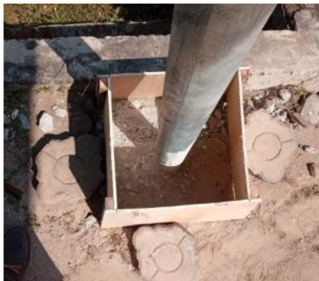
Gambar 5 Pemasangan Bekisting

PJU yang terletak di Desa Wonokerto, Kecamatan Wonosalam, Kabupaten Jombang, Jawa Timur direncanakan didirikan 50 titik, namun dalam pelaksanaan tahap awal baru realisasi 27 titik termasuk 1 titik panel listrik. Pekerjaan PJU ini dibagi dalam 2 kegiatan, pertama kegiatan sipil yaitu pembuatan pondasi tiang PJU dan pemasangan